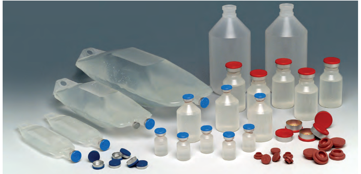
Präzise Abfüllung von Infusionsbeuteln, Vials und Spritzen

Die Anlage schützt Patienten und Bedienperson gleichermaßen: den einen vor Verunreinigungen, den anderen vor Produkt- bzw. Wirkstoffexposition. Es können die jeweiligen Packmittel massgeschneidert für jeden Patienten abgefüllt werden. Dank der hohen Automation werden die über 20 Grundstoffe in genau der richtigen Dosierung ohne Menschenkontakt abgefüllt. Die skalierbare Lösung ist auch mit Zu- und Abfuhr in einem geschlossenen System möglich.