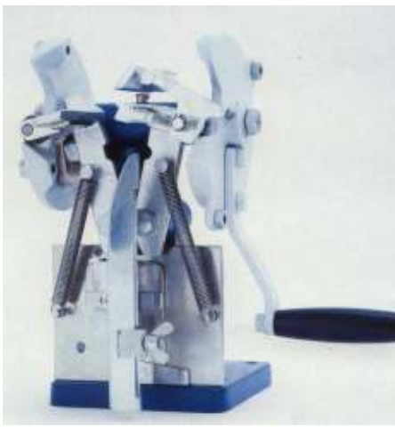
SD1, crank driven SD1, Antrieb durch Handkurbel