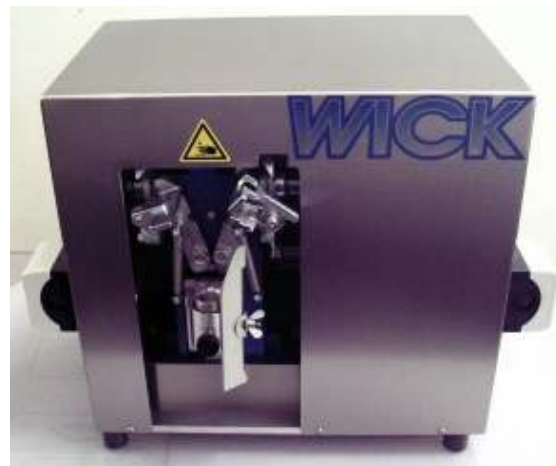
SD1m, electrically driven SD1m, elektrischer Antrieb