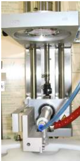
Auflege-Station für Folienscheiben mit Vakuumwender und Vorsiegeleinrichtung