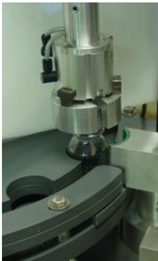
Greiferschrauber für sichere Drehmomentübertragung auch bei sehr glatten Verschlüssen