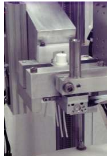
Einsetzer für Sprühpumpen inkl. Ausrichtung und Straffung des Steigrohres