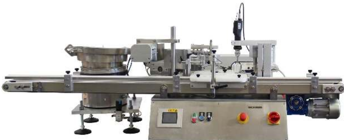
Ausführung / design: Minican 50-TB/ST